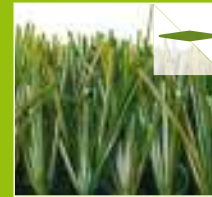
BERMUDA MEMORY II