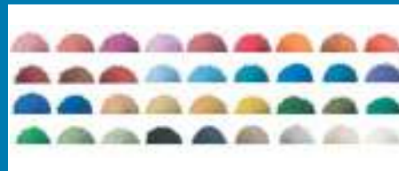
AREIA DE SILICA