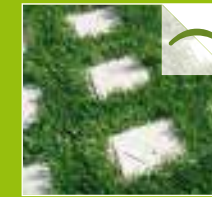
BERMUDA CHECKER BLOCK