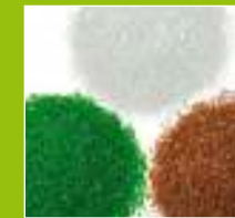
ARENA DE SÍLICE